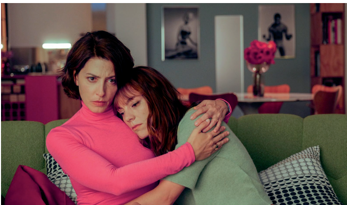
«AUTOFICTION» réalisé par Pedro Almodóvar en v.f & v.o.s.t