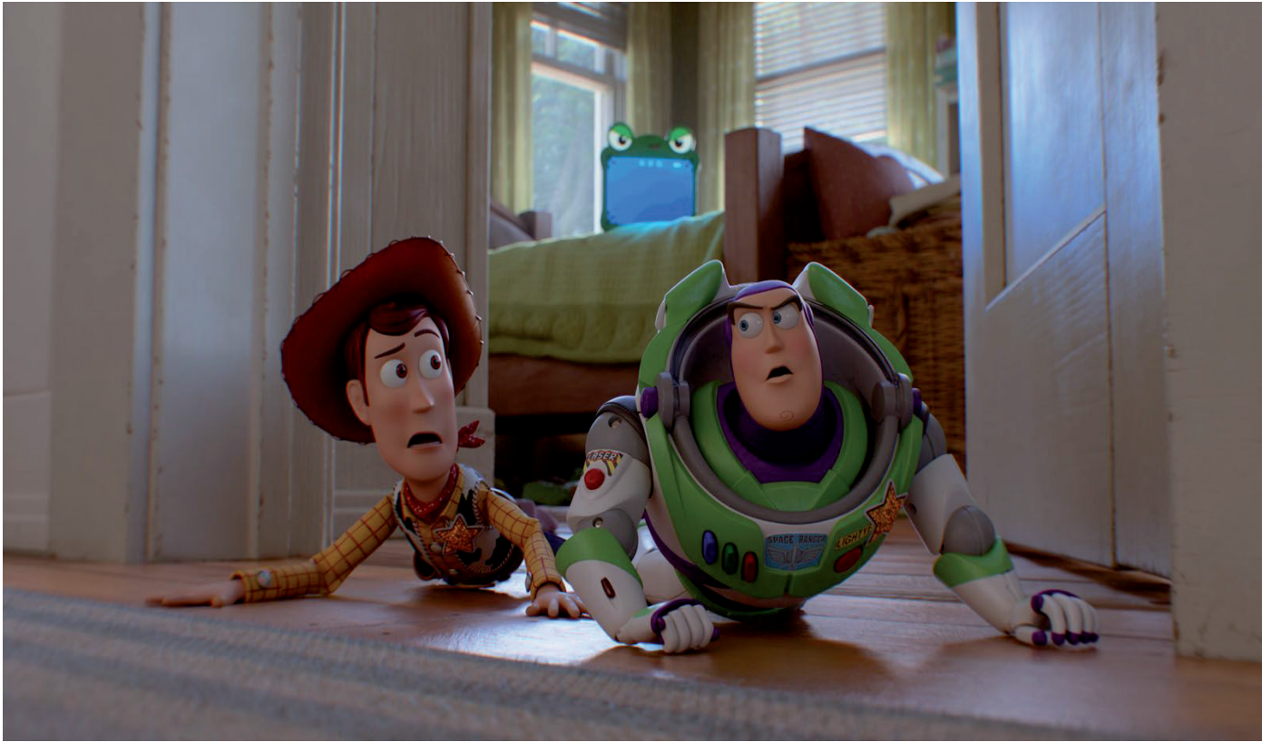
«TOY STORY 5» réalisé par Andrew Stanton, McKenna Harris en Sortie Nationale