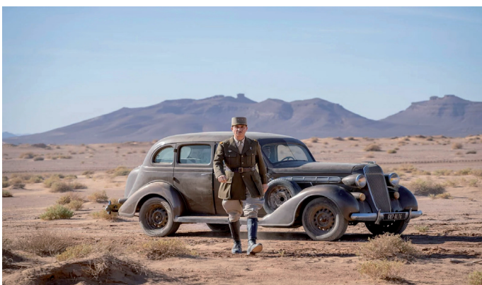
«LA BATAILLE DE GAULLE, J'ÉCRIS TON NOM» réalisé par Antonin Baudry en Sortie Nationale